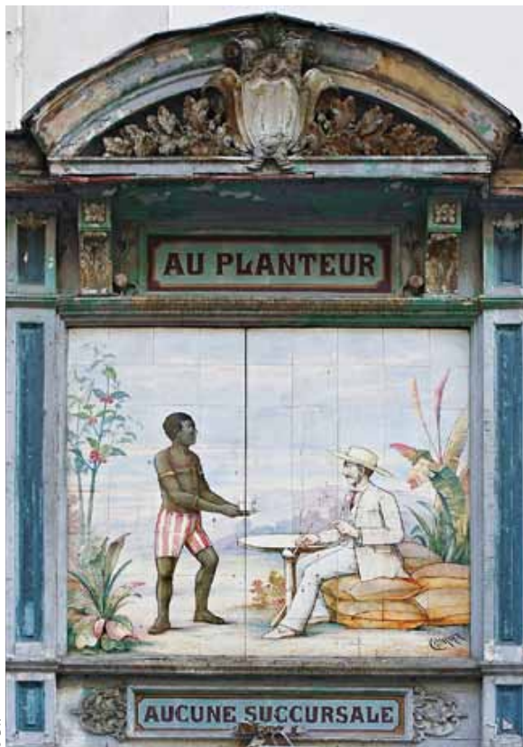
Enseigne parisienne de torréfacteur (1890), rue des Petits-Carreaux, Paris 2 e .

Ce même XX e siècle aura aussi été celui de la lutte contre le racisme. Le sortir de l'oubli et de la négation, s'appuyer sur des faits et des chiffres irréfutables aura été le grand travail des historiens du monde entier, y compris en Afrique (6) ; depuis